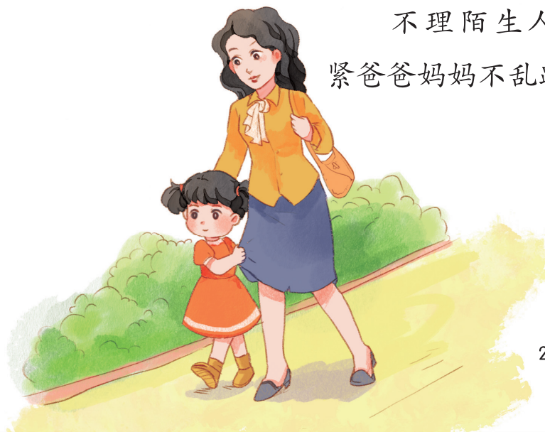
不理陌生人，牵 紧爸爸妈妈不乱跑