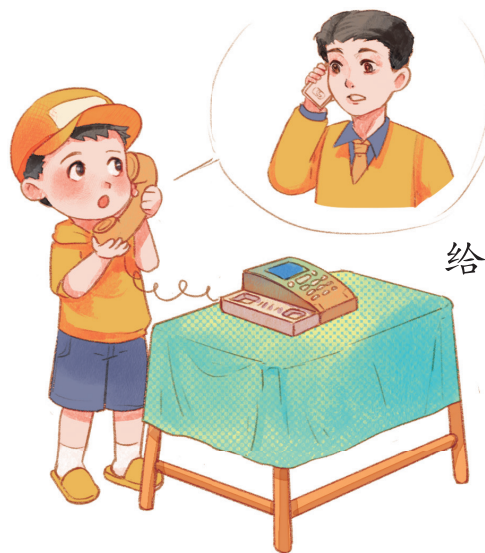
先不开门，打电话 给爸爸妈妈问情况