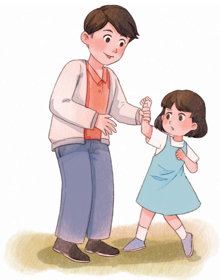
有陌生人要带走自己